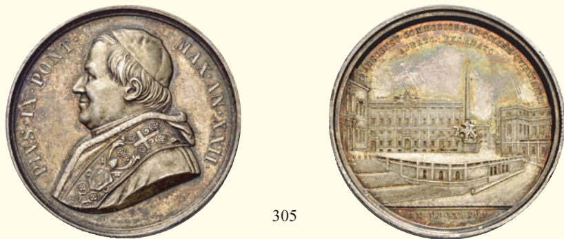
305 Medaglia anno XXII/1867. AR 35,07 g. ø 43,50 mm. Per la realizzazione della scalinata di accesso alla piazza del Quirinale (opus: Ignazio Bianchi). PIVS · IX · PONT – MAX · AN · XXII · Busto a s. con zucchetto, mozzetta e stola ornata da croce, stemma e fiorami; sotto, nel giro, I BIANCHI S. Rv. ADSCENSU COMMODIORE AD COLLEM QVIRINALEM / APERTO EXORNATO Veduta della piazza del Quirinale, sullo sfondo il palazzo della Consulta; all’esergo, AN MDCCLXVII. Sulla linea d’esergo, in rilievo, VIRG VESPIGNANI ARCH I BIANCHI S. Lincoln 2301. R.Z. 748. Bartolotti E867.

Per questo millesimo risultano coniatati 1.115 esemplari, ma difficilmente sono reperibili in perfetto stato di conservazione come quello qui proposto.