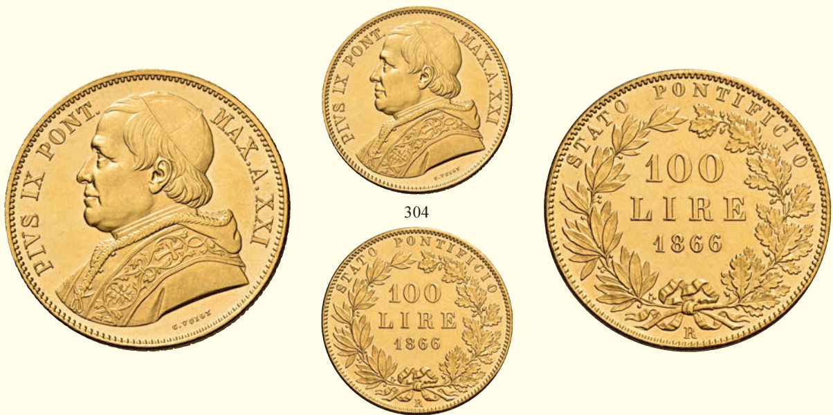
304 Pio IX (Giovanni Maria Mastai Ferretti), 1846-1878. Monetazione decimale: 1866-1870. Da 100 lire anno XXI/1866. Pagani 519. Berman 3330.

Molto rara. Fondi speculari e conservazione eccezionale, Fdc 10.000