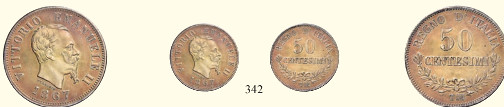
342 Da 50 centesimi 1867 Torino. Valore. Pagani 533. MIR 1088g.

Molto rara. Incantevole patina iridescente, q.Fdc