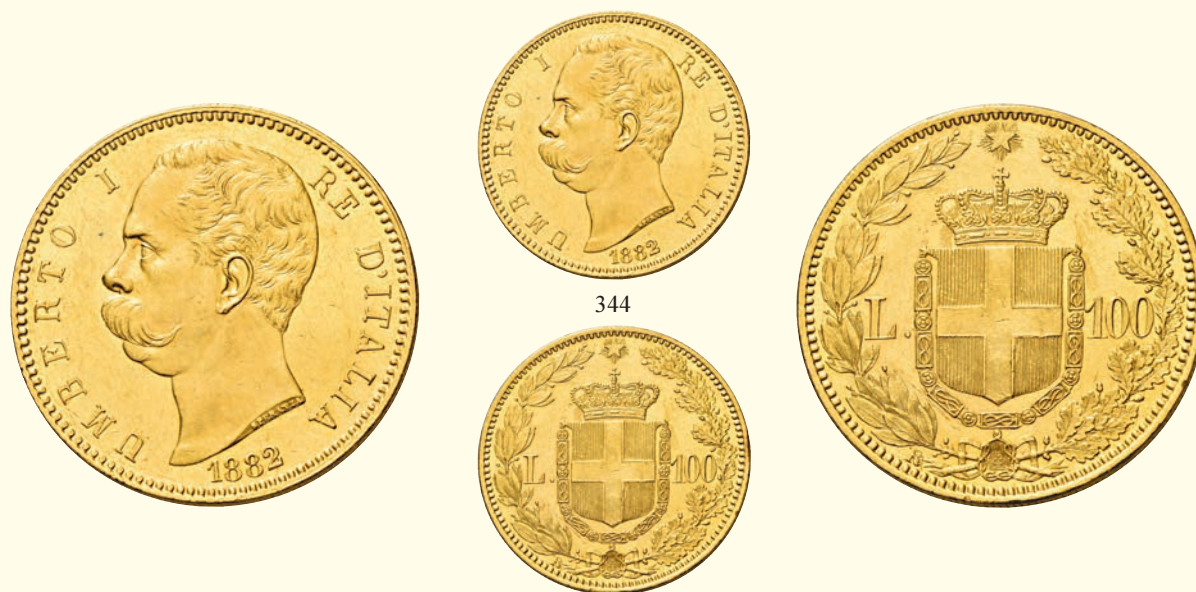
344 Umberto I re d'Italia, 1878-1900. Da 100 lire 1882. Pagani 568. MIR 1096b.