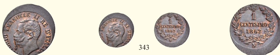
343 Centesimo 1862 Napoli. Conio decentrato. Pagani 564 var. MIR 1095d var.