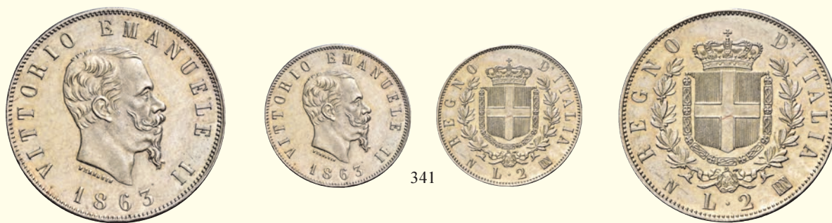
341 Da 2 lire 1863 Napoli. Stemma. Pagani 506. MIR 1083c.