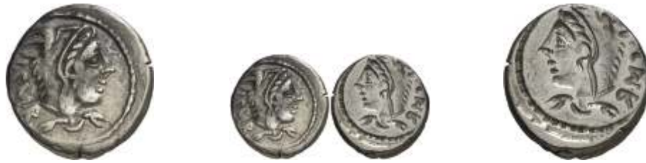
1398 Gens Thoria. (105 a.C.). Norte de Italia. Denario. (Craw. 316/1) (FFC. 1141). Anv.: Cabeza de Juno Sospita cubierta con la piel de cabra, detrás I. S. M. R. Rev.: Incuso. 3,87 g. MBC+ .....