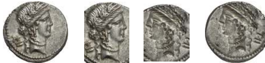
1400 Júlio César. (48-47 a.C.). Galia. Denario. (Craw. 452/2) (FFC. 14). Anv.: Cabeza laureada y diademada de la Piedad, detrás LII. Rev.: Incuso. Bella. 4,03 g. EBC .....