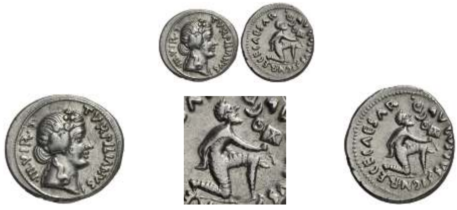
1355 (19 a.C.). Denario. (RIC. 287) (FFC. 306, mismo ejemplar ). Anv.: Cabeza de Liber coronada de yedra, detrás III VIR, delante TVRPILIANVS. Rev.: CAESAR AVGVSTVS SIGN. RECE. Guerrero parto arrodillado, presentando una insignia militar. Pequeñas rayitas en anverso. 3,95 g. EBC- . . . . . 250,-