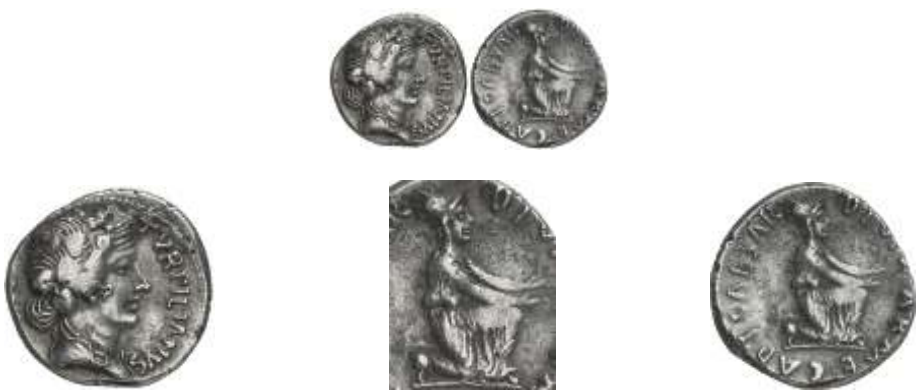
1356 (18 a.C.). Denario. (RIC. 290) (FFC. 311, mismo ejemplar ). Anv.: Cabeza de Liber coronada de yedra, detrás (III VIR), delante TVRPILIANVS. Rev.: CAESAR DIVI F. ARME. CAPT. Armenio arrodillado extendiendo las manos. 3,81 g. MBC+ . . . . . 225,- Ex Colección Leo Benz, Lanz 23/11/1998, nº 926.