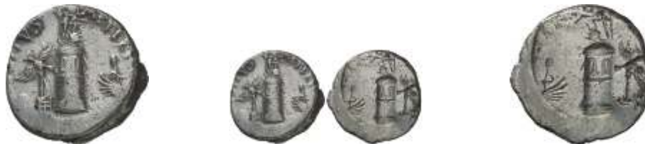
1402 Sexto Pompeyo. (42-40 a.C.). Sicilia. Denario. (Craw. 514/4) (FFC. 6). Anv.: (MAG. P)IVS IMP IMP. ITER. El faro de Messina coronado por la estatua de Neptuno, sobre galera con águila legionaria, acrostolium, tridente y vara. Rev.: Incuso. 3,83 g. MBC .....