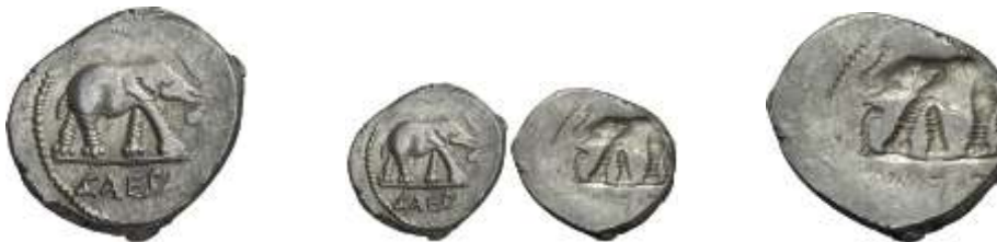
1401 (54-51 a.C.). Galia. Denario. (Craw. 443/1) (FFC. 50). Anv.: Elefante, delante serpiente, en exergo CAESA(R). Rev.: Incuso. 4,14 g. MBC .....