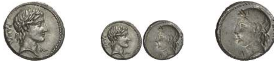
1399 Gens Vibia. (90 a.C.). Denario. (Craw. 342/5b) (FFC. 1189). Anv.: Cabeza laureada de Apolo, detrás PANSA, A bajo el mentón. Rev.: Incuso. Atractiva. 3,94 g. EBC .....