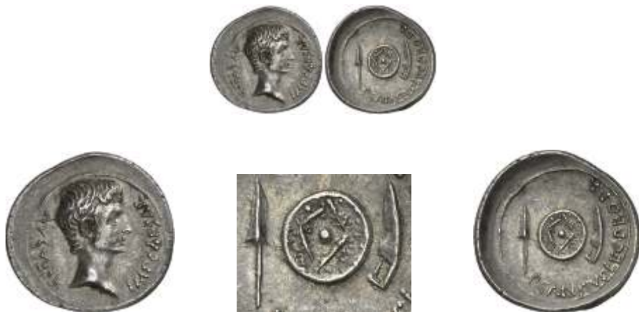
1324 (23 a.C.). Emérita. Denario. (RIC. 3) (FFC. 251, mismo ejemplar ). Anv.: IMP. CAESAR AVGVSTVS. Cabeza desnuda de Octavio Augusto. Rev.: P. CARISIVS LEG. PRO. PR. Punta de lanza, escudo y falcata. Bella. Muy rara. 3,58 g. EBC . . . . . 1.500,-