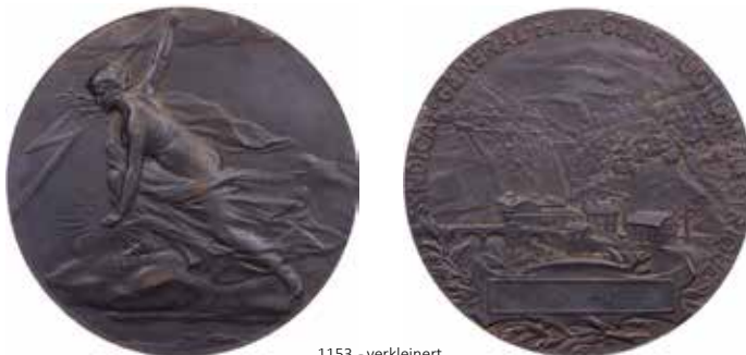
1153 - verkleinert

Die Bergnymphe Daphne wurde von Apollon begehrt. Sie erflehte göttliche Hilfe, ihre verführerische Gestalt sollte verschwinden. So wurde sie in einen Lorbeerbaum verwandelt. Seitdem war Lorbeer dem Apollon heilig und der Lorbeerkranz wurde sein Kennzeichen.