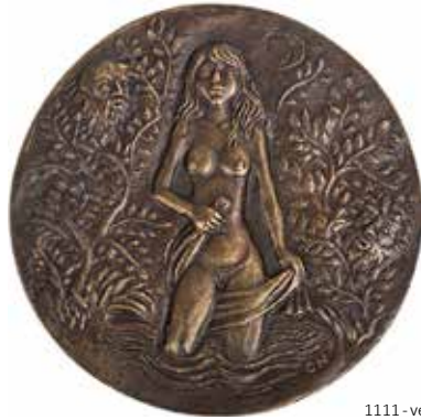
1111 - verkleinert