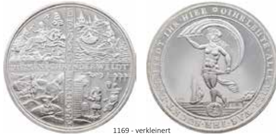
1169 - verkleinert