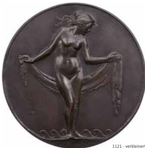
1121 - verkleinert