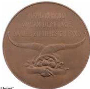
1178 - verkleinert