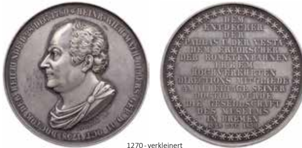
1270 - verkleinert