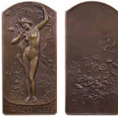
1162 - verkleinert