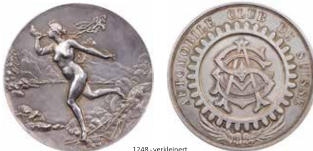
1248 - verkleinert