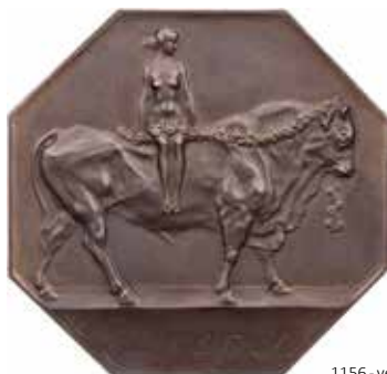
1156 - verkleinert