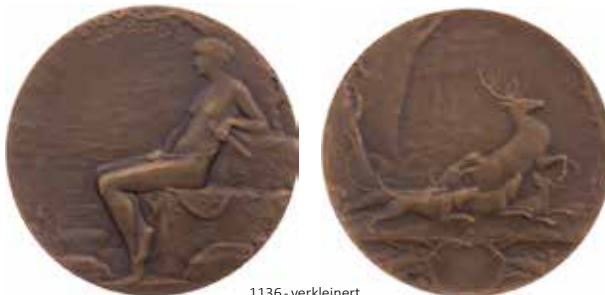
1136 - verkleinert