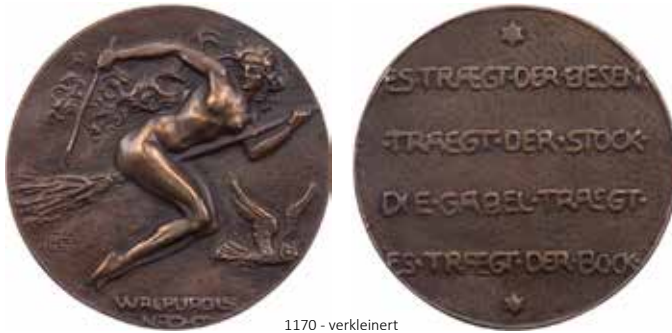
1170 - verkleinert