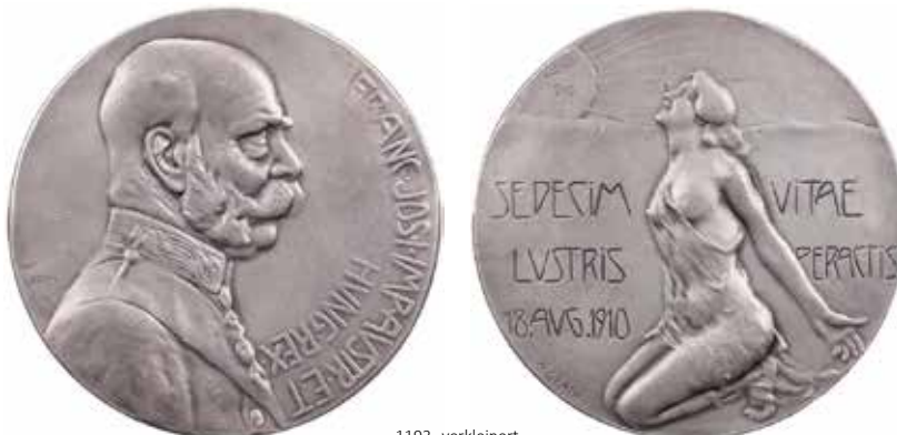
1193 - verkleinert