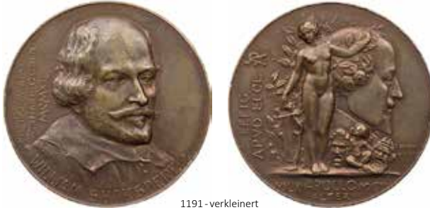
1191 - verkleinert