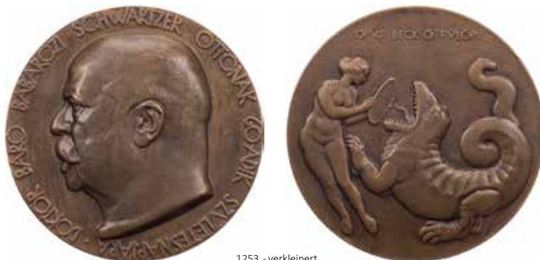
1253 - verkleinert