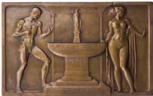
1182 - verkleinert