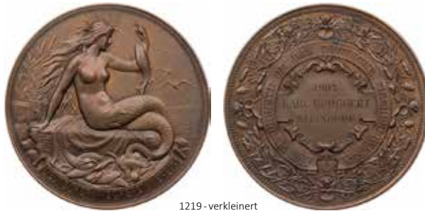
1219 - verkleinert