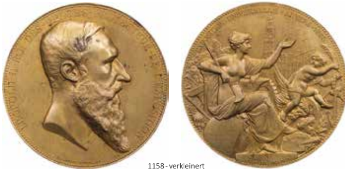
1158 - verkleinert