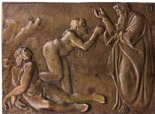
1104 - verkleinert