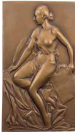
1180 - verkleinert