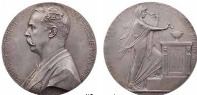
1271 - verkleinert