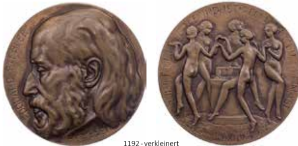
1192 - verkleinert