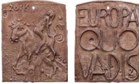
1157 - verkleinert