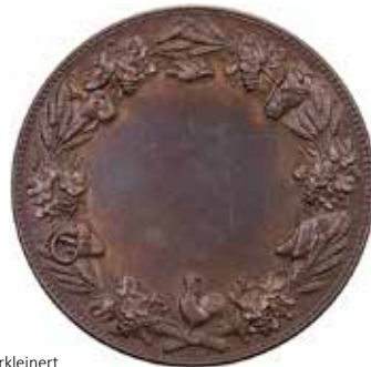
1196 - verkleinert