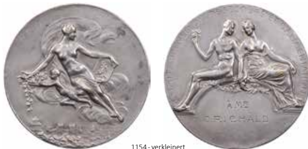
1154 - verkleinert