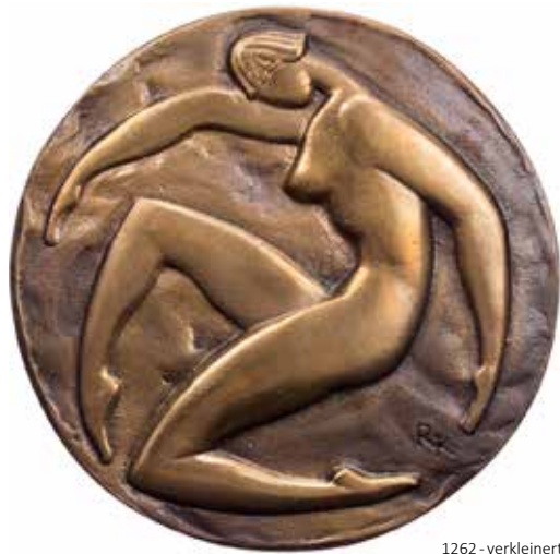
1262 - verkleinert