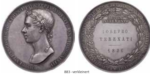
883 - verkleinert