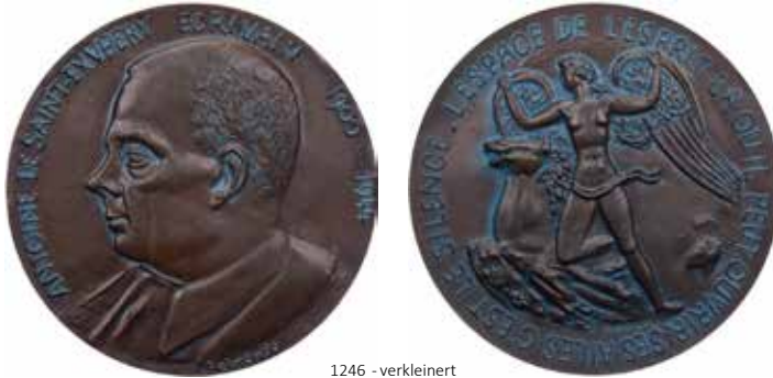
1246 - verkleinert