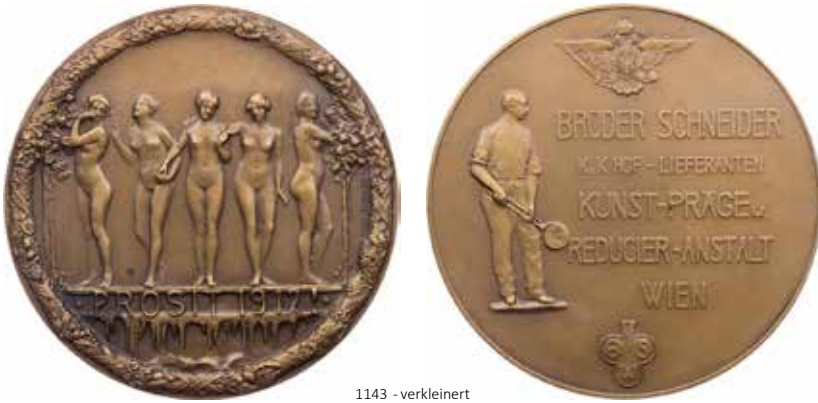
1143 - verkleinert