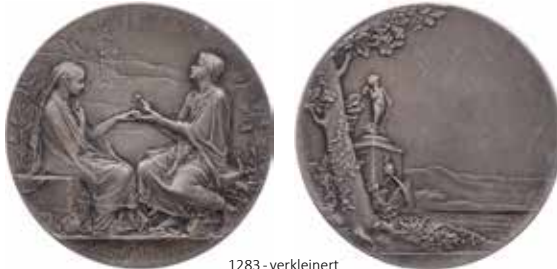
1283 - verkleinert