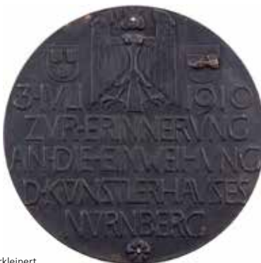
1132 - verkleinert