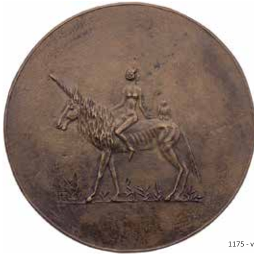
1175 - verkleinert