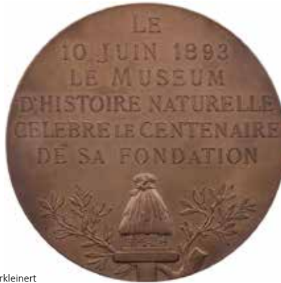
1200 - verkleinert