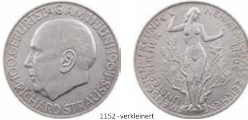
1152 - verkleinert