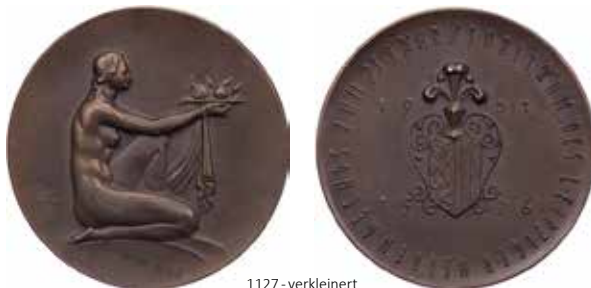
1127 - verkleinert