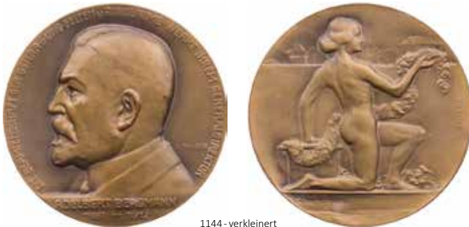
1144 - verkleinert