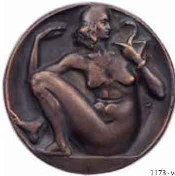
1173 - verkleinert