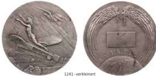
1241 - verkleinert