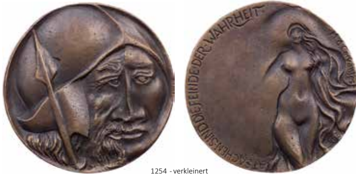
1254 - verkleinert