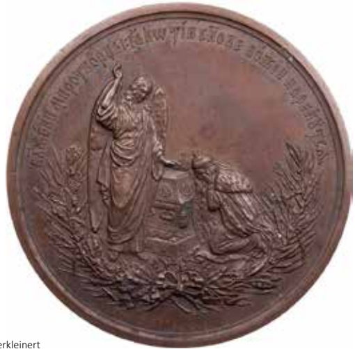
1012 - verkleinert