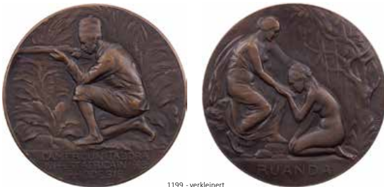
1199 - verkleinert

Die westfränkischen Karolinger hatten das Aufgebot des dänischen Normannen Rollo bei Chartres geschlagen und schlossen mit ihm 911 den Vertrag von St. Clair sur Epte. Die Normannen mussten sich taufen lassen und die Seine für andere Wikinger sperren. Dafür erhielten sie die Grafschaft Rouen und die Seinemündung als Lehen, woraus das Herzogtum Normandie entstand.