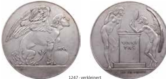
1247 - verkleinert