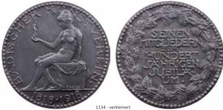
1134 - verkleinert