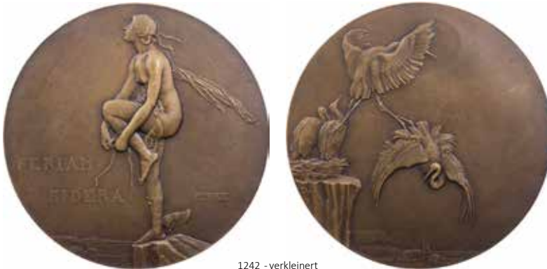
1242 - verkleinert