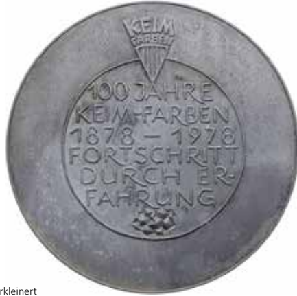
1149 - verkleinert