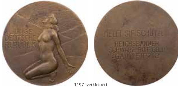
1197 - verkleinert