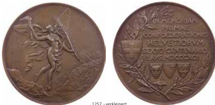
1257 - verkleinert