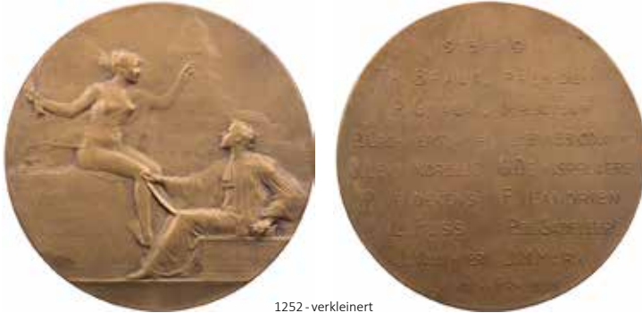
1252 - verkleinert