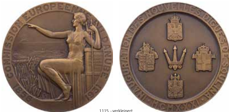
1115 - verkleinert