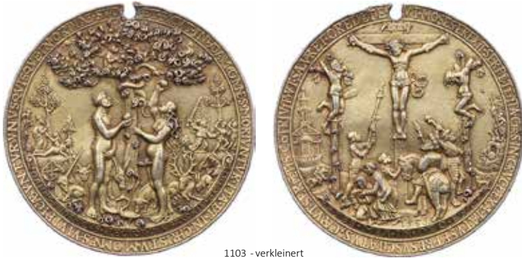
1103 - verkleinert