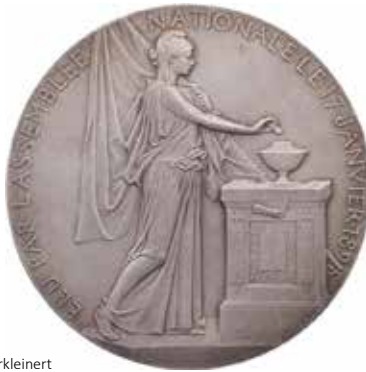
1273 - verkleinert