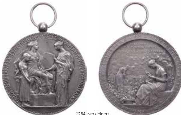
1284 - verkleinert