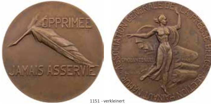
1151 - verkleinert