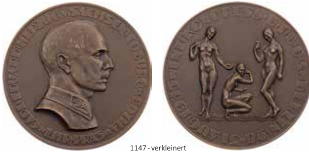
1147 - verkleinert