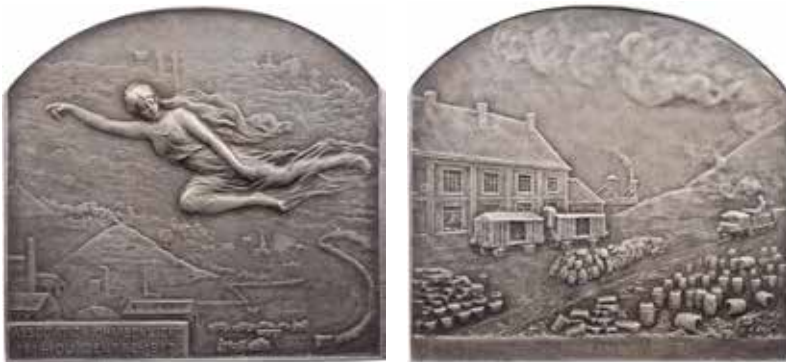
1281 - verkleinert