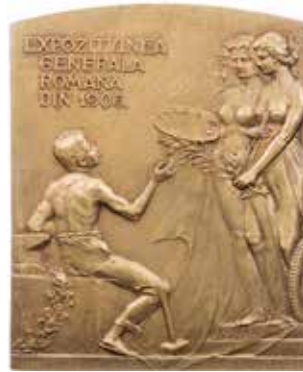
1131 - verkleinert