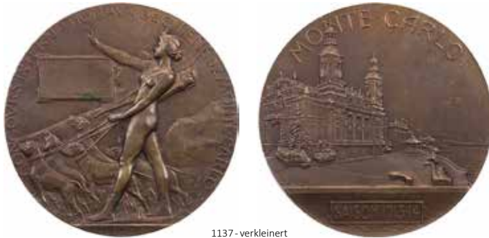
1137 - verkleinert