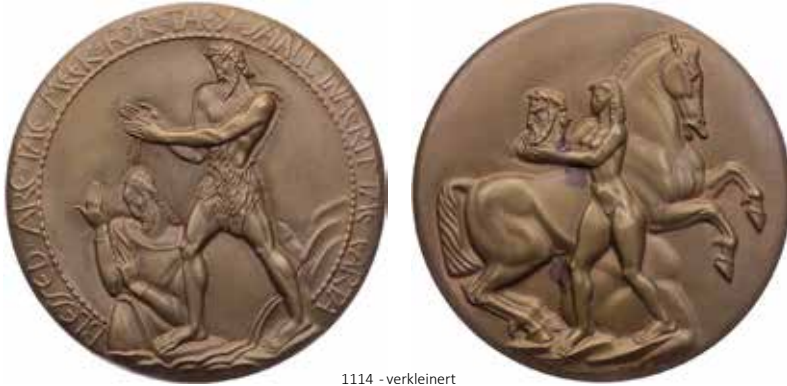
1114 - verkleinert