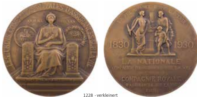
1228 - verkleinert