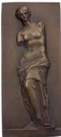
1120 - verkleinert