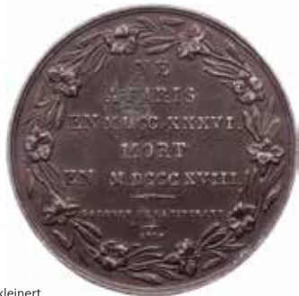
961 - verkleinert