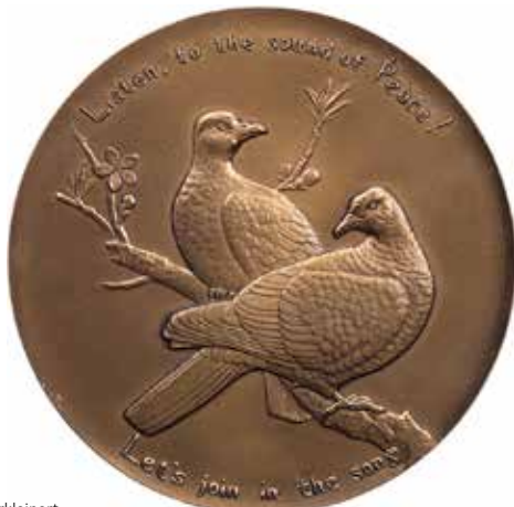
1161 - verkleinert