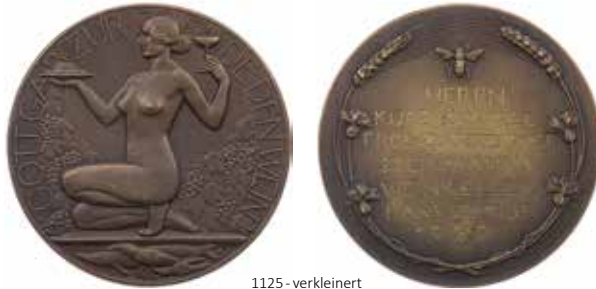
1125 - verkleinert