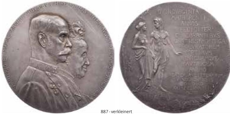
887 - verkleinert