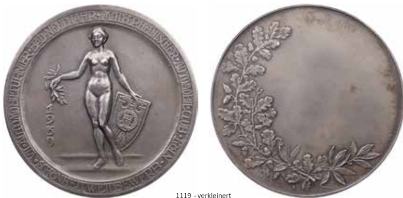
1119 - verkleinert