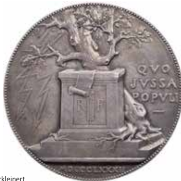
1274 - verkleinert