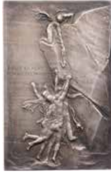
1272 - verkleinert