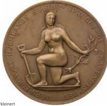
1195 - verkleinert