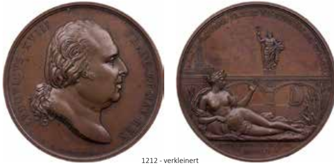
1212 - verkleinert