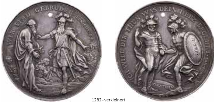
1282 - verkleinert