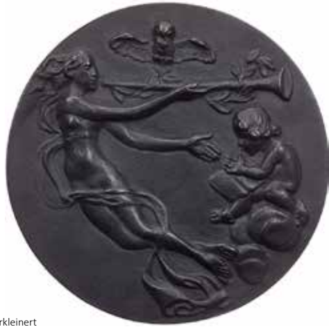
1160 - verkleinert