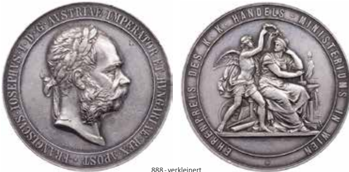
888 - verkleinert