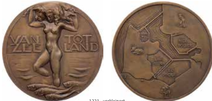
1221 - verkleinert