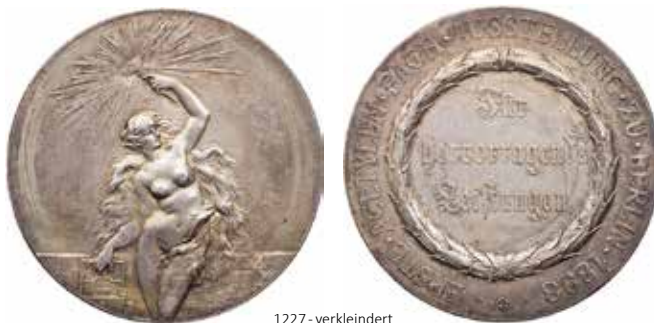
1227 - verkleinert