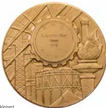
1216 - verkleinert