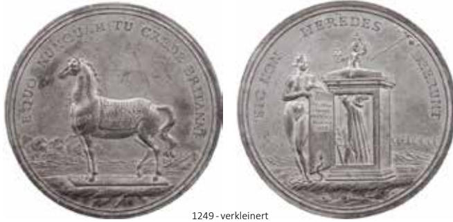
1249 - verkleinert