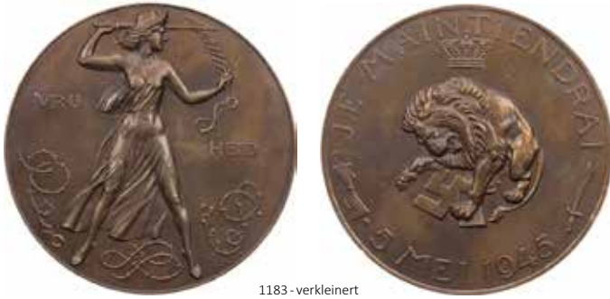
1183 - verkleinert