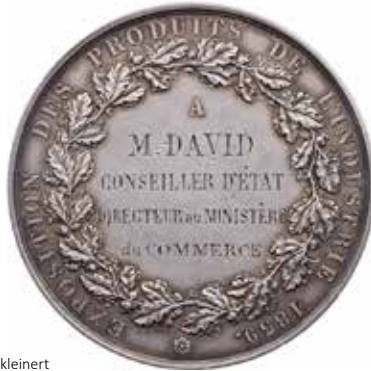
959 - verkleinert