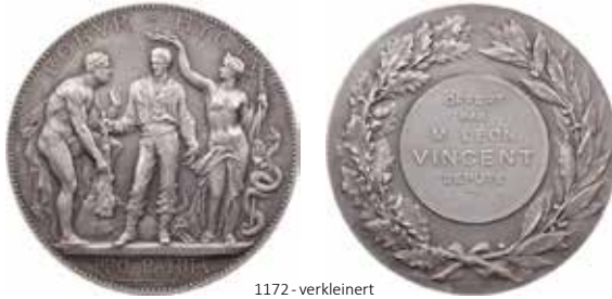
1172 - verkleinert