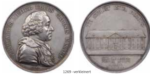
1269 - verkleinert