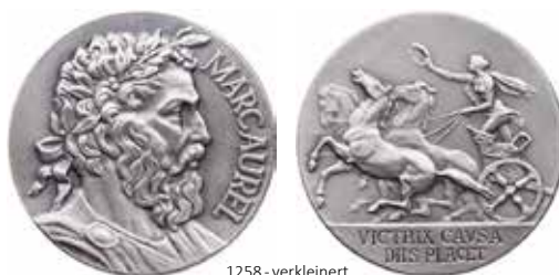
1258 - verkleinert