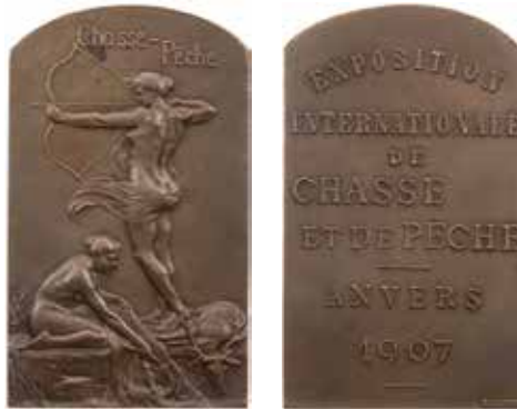
1135 - verkleinert