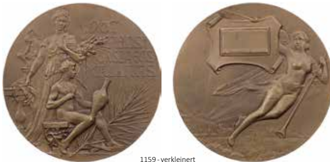
1159 - verkleinert

Fama war in der Antike eine vielgestaltige Allegorie des Gerüchts. Ovid, Metamorphosen 12, 39-63, beschreibt die gespenstische Burg der Fama, wo auch Credulitas (Leichtgläubigkeit), Error (Irrtum), Laetitia (Freude), Susurri (Geflüster) und Seditio (Zwietracht) wohnen. In der Neuzeit wurde Fama zur Allegorie des Ruhmes.