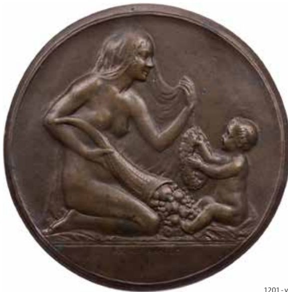
1201 - verkleinert