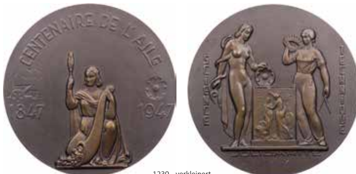
1230 - verkleinert