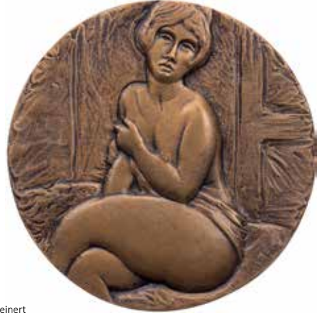
1263 - verkleinert