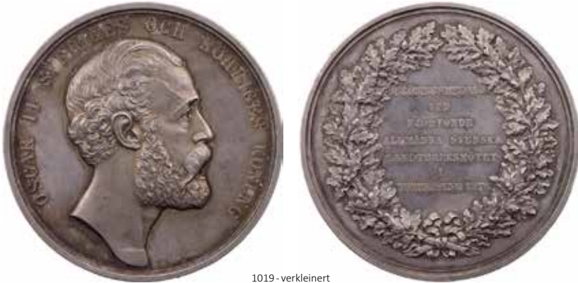
1019 - verkleinert