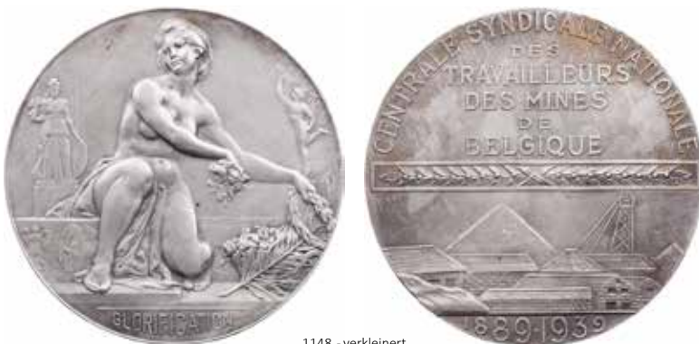
1148 - verkleinert