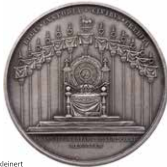
960 - verkleinert