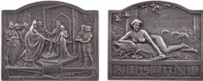
1198 - verkleinert