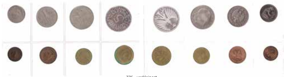
776 - verkleinert