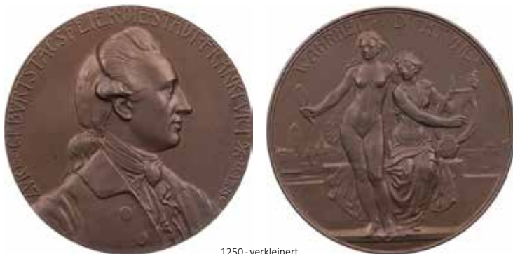
1250 - verkleinert

Du, Brite, glaub niemals dem Pferd / So fehlen nicht die Erben - Jakob Francis Edward, der ausgewechselt, am 20. Juni 1688 Jakob II. war bereits 1668 oder 1669 zum katholischen Glauben konvertiert und hatte 1673 in zweiter Ehe die katholische Prinzessin Maria von Modena geheiratet. Den Unwillen der anglikanischen Briten suchte er zu beschwichtigen, indem er seine anglikanische Tochter aus erster Ehe, Maria, 1677 den protestantischen Statthalter der Freien Niederlande, William III. von Oranien, heiraten ließ. Seit 1685 König, betrieb Jakob II. kompromisslose Politik gegen die Anglikaner. Als dann mit James Francis Edward 1688 der katholische Thronfolger geboren wurde, revoltierten die anglikanischen Widersacher und forderten William auf, aus den Niederlanden anzugreifen. Schnell war der Sieg errungen, Jakob floh nach Frankreich und William III. regierte mit Maria das anglikanische England. Betreffs der Geburt des Thronfolgers war 1688 das Gerücht verbreitet worden, der kleine Prinz sei alsbald gestorben und durch ein anderes Baby ersetzt worden: Die nackte Wahrheit tritt auf die Teufelsschlange und entlarvt den angeblichen Täter, den Beichtvater des Königs, den Jesuiten Edward Petre.