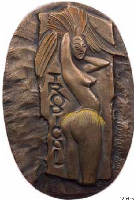
1264 - verkleinert