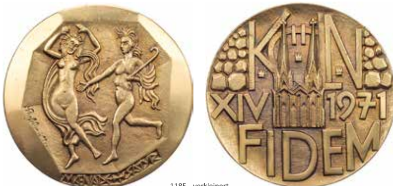
1185 - verkleinert