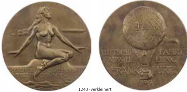
1240 - verkleinert