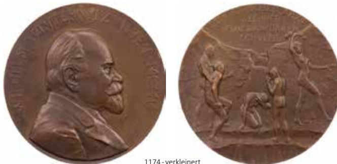
1174 - verkleinert