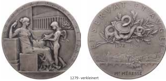
1279 - verkleinert