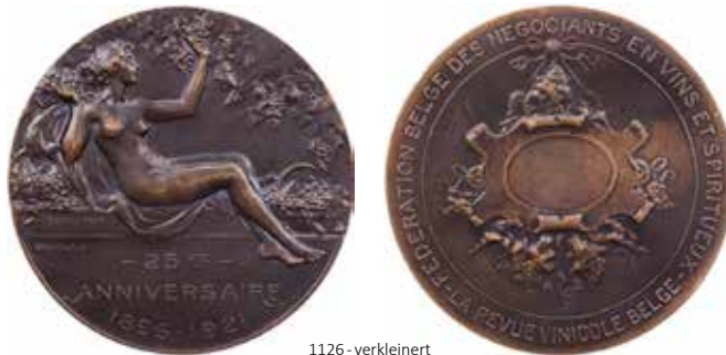
1126 - verkleinert