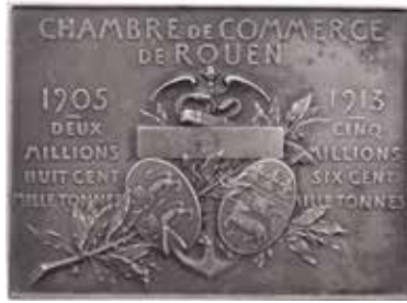
1215 - verkleinert