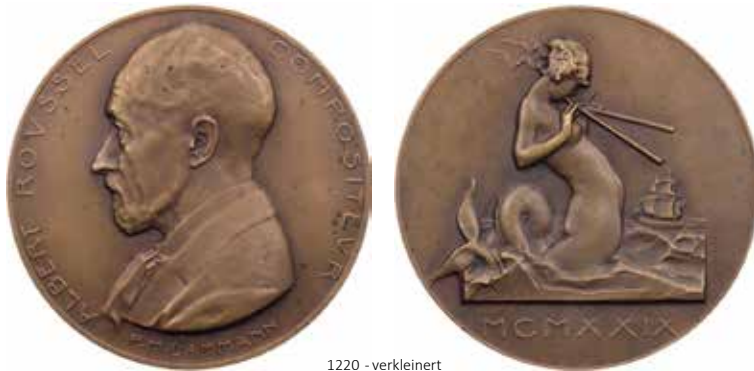
1220 - verkleinert