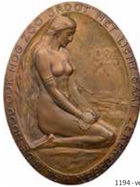
1194 - verkleinert