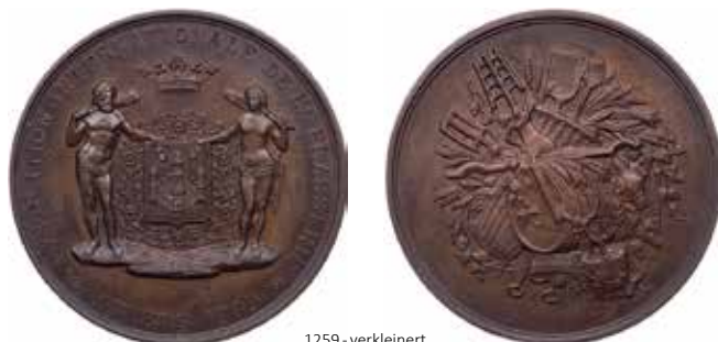
1259 - verkleinert