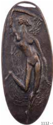
1112 - verkleinert