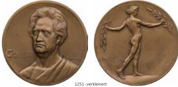
1251 - verkleinert