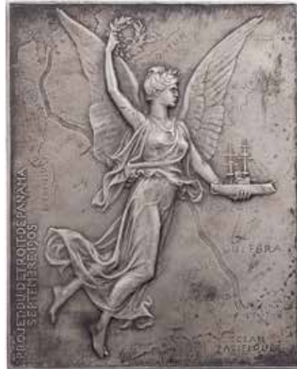
1275 - verkleinert