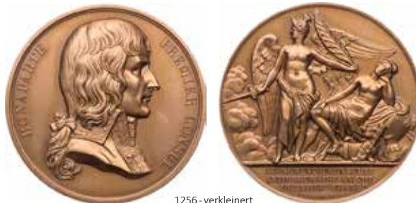
1256 - verkleinert

Die ausgebaut Uferstraße folgte der alten römischen Verbindung. Mit dem Reversbild werden traianische Münzen auf die Eröffnung der Straße von Benevent nach Brindisi mit der Beischrift VIA TRIANA zitiert.