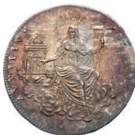
518. Mezzo Scudo 1829, Roma. Pag. 143 Ag g 13,23 Rara