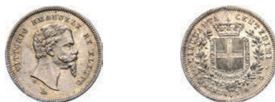
402. 50 Centesimi 1860 Firenze "baffo a punta". MIR 1069b Pag. 443a Ag g 2,50 FDC 300