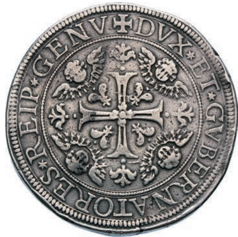
277. Da 4 Scudi 1684, sigle PBM. D/ La Madonna col Bambino sulle nubi; sopra di loro due angeli con una corona di stelle R/ Croce ornata; nei quarti testine di cherubini. CNI 1 MIR 287/9 Ag g 152,34 Rarissima