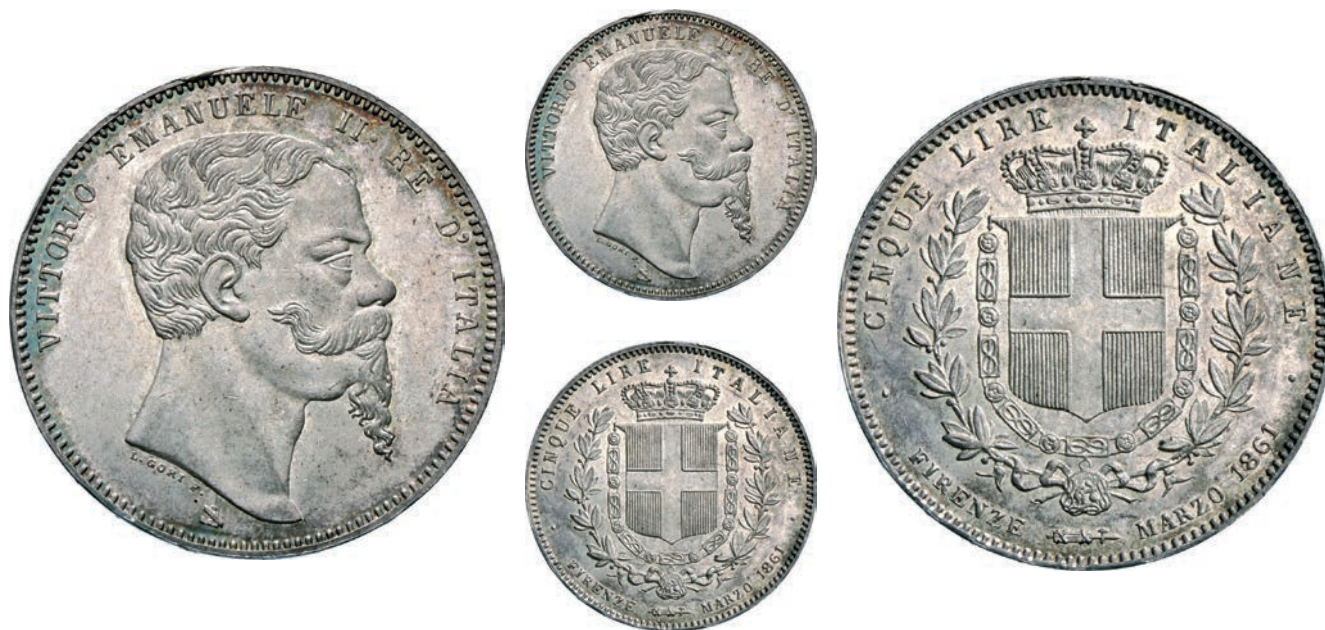
403. VITTORIO EMANUELE II (1861-1878) 5 Lire 1861 Firenze. MIR 1081a Pag. 481 Ag g 24,93 Molto rara SPL÷FDC 3.500