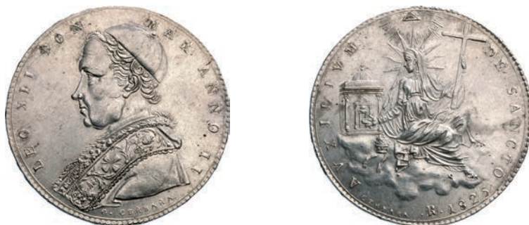
515. LEONE XII (1823-1829) Scudo 1825 II, Roma. Al R/ raggi fini. Pag. 131 Ag g 26,42 Rara • Minimi segnetti ma bellissimo esemplare SPL÷FDC 500