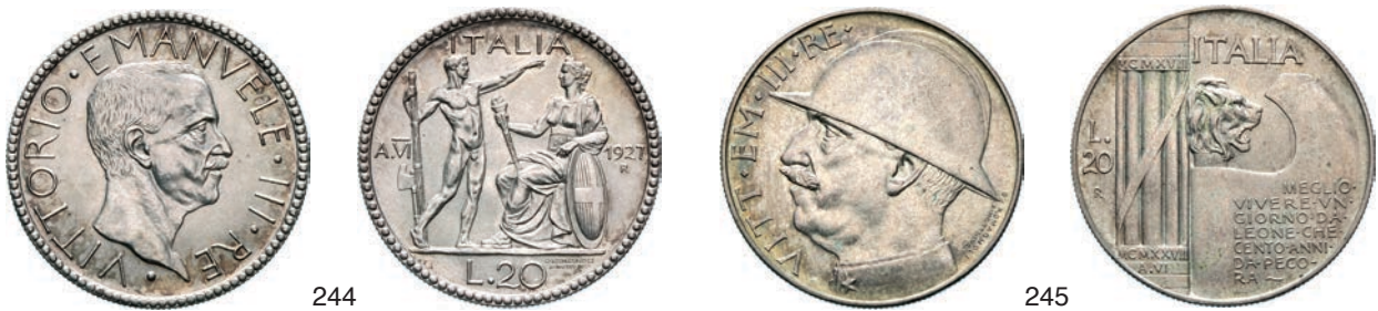
244. 20 Lire 1927 VI Roma "littore". Pag. 672 MIR 1128b Ag g 14,98 FDC 300