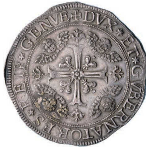
278. Da 2 Scudi 1693, sigle ITC. D/ La Madonna col Bambino sulle nubi; sopra di loro due angeli con una corona di stelle R/ Croce ornata; nei quarti testine di cherubini. Lun. 259 MIR 290/27 Ag g 76,25 Rara • Piacevole esemplare, patinato