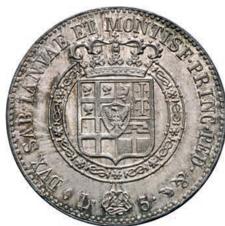
391. 5 Lire 1820 Torino. MIR 1030d Pag. 14 Ag g 25,04 Rara • Di grande conservazione