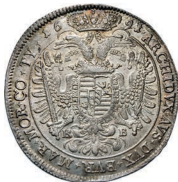
932. SACRO ROMANO IMPERO LEOPOLDO I (1657-1705) Tallero 1691, Kremnitz. Kr. 214.2 Dav. 3261 Ag g 28,97 SPL÷FDC 350