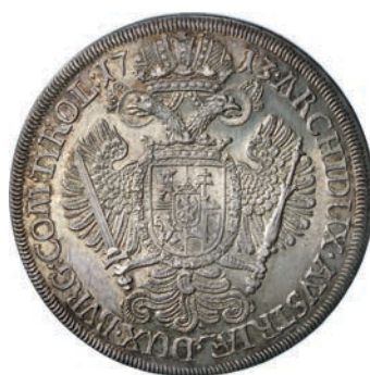
933. SACRO ROMANO IMPERO CARLO VI (1711-1740) Tallero 1713, Hall. Kr. 691 Dav. 1050 Ag g 28,29 SPL÷FDC 300