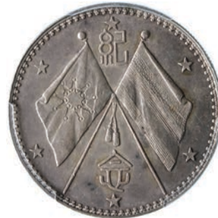
770. Dollaro s.d. (1923) Kr. 678 L.&M. 959 Ag • PCGS AU58