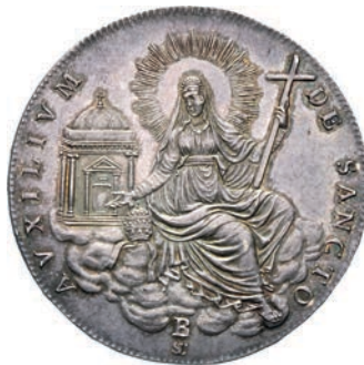
517. SEDE VACANTE (1829) Scudo 1829, Bologna. Pag. 122 Ag g 26,49 Rara • Bellissima patina con iridescenze