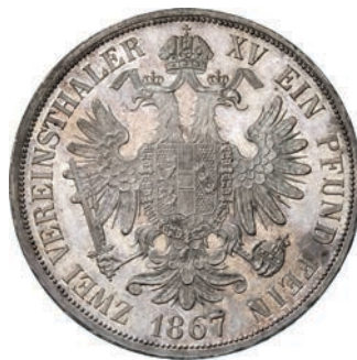
733. Doppio Tallero 1867, Vienna. Dav. 24 Ag g 37,03