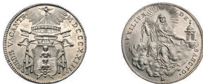
514. Mezzo Scudo 1823, Bologna. Pag. 113 Ag g 13,17 SPL÷FDC 400