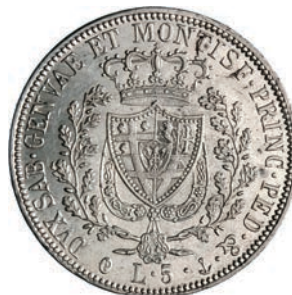
392. CARLO FELICE (1821-1831) 5 Lire 1827 Genova. MIR 1035j Pag. 72 Ag g 25,04