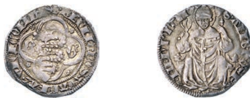
299. MILANO BARNABO' e GALEAZZO II VISCONTI (1355-1378) Grosso da 2 Soldi. CNI 9/35 Crippa 2a N.V. 79 MIR 102/1 Ag g 2,59 • Gradevole patina BB÷SPL 150