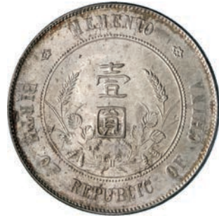
772. Dollaro s.d. (1927) Memento. Y. 318a.1 Dav. AAO 218 Ag g 26,46 q.FDC 150