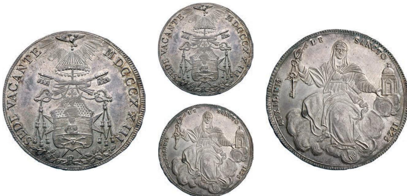
513. SEDE VACANTE (1823) Scudo 1823, Roma. Pag. 123 Au g 26,48 Rarissima • Solo 885 esemplari conati; esemplare di grande conservazione e con bella patina SPL÷FDC 4.500