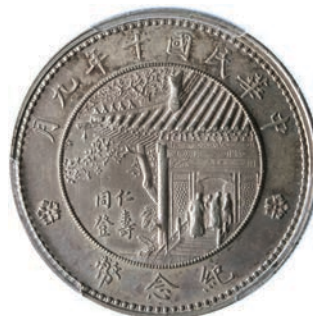
769. Dollaro s.d. (1921) Kr. 676 L.&M. 864 Ag • PCGS MS63