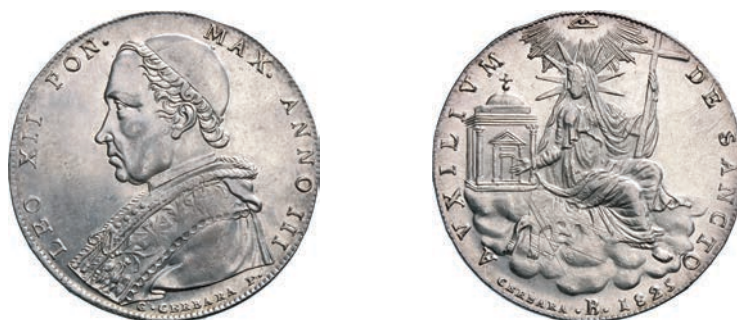
516. Scudo 1825 III, Bologna. Al R/ raggi medi. Pag. 117 Ag g 26,48 SPL 350