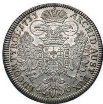
934. Tallero 1733, Hall. Kr. 695.1 Dav. 1055 Ag g 28,32 FDC 300