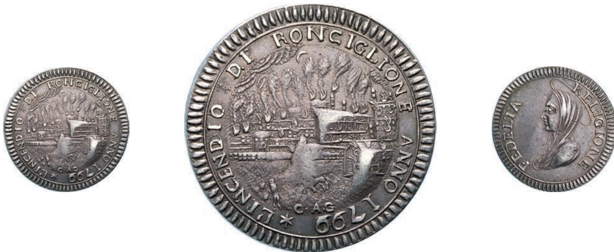
510. OCCUPAZIONE AUSTRIACA (1799) 3 Baiocchi 1799 in argento, Rocciglione. D/ Veduta della città in fiamme. Pag. - Ag g 17,17 Rarissima • Bella patina BB÷SPL 1.500