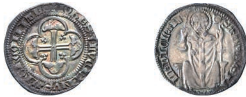
297. MILANO LUCHINO e GIOVANNI VISCONTI (1339-1349) Grosso da 2 Soldi. CNI 4/14 Crippa 3a N.V. 72 MIR 94/1 Ag g 2,78 • Bellissima patina iridescente BB÷SPL 250