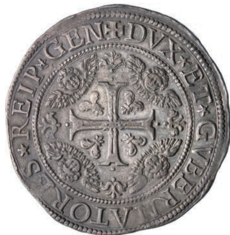
279. Da 1 Scudo e mezzo 1641, sigle CS. D/ La Madonna col Bambino sulle nubi; sopra di loro due angeli con una corona di stelle R/ Croce ornata; nei quarti testine di cherubini. Lun. 272 MIR 291/1 Carige 586 Ag g 57,57 • Di grande rarità , pochissimi esemplari noti