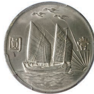
773. Dollaro s.d. (1932) Y. 344 L.&M. 108 Ag • PCGS UNC detail, cleaned SPL/q.FDC 1.500