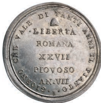
509. Scudo o medaglia A. VII (1798) R/ XXVII PIOVOSO... Pag. 4 Ag g 23,68 Rara SPL 1.500