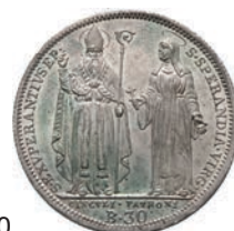
519. PIO VIII (1829-1830) Scudo 1830 I, Roma. Pag. 145 Ag g 26,44 Rara • Eccezionale q.FDC 1.200