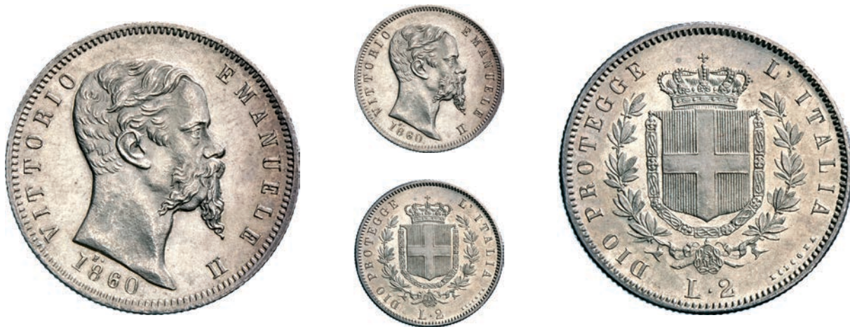
400. 2 Lire 1860 Bologna. MIR 1064b Pag. 435 Ag g 9,95 Molto rara • Eccezionale q.FDC/FDC 8.000