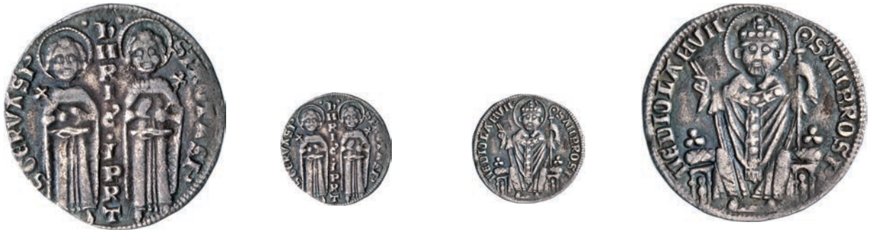
296. MILANO ENRICO VII DI LUSSEMBURGO, IMPERATORE (1312-1313) Grosso. CNI 15/23 N.V. 52 MIR 77 Ag g 1,98 Rarissima • Gradevole patina BB 1.200