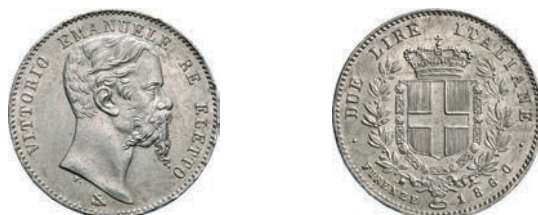
401. 2 Lire 1860 Firenze. MIR 1065a Pag. 436 Ag g 9,91 Rara • Minimi segni di contatto al diritto q.FDC 600