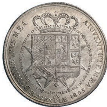
500. CARLO LUDOVICO DI BORBONE, reggenza della madre Maria Luisa (1803-1807) Dena 1805. Pag. 25 Ag g 39,45 Rara