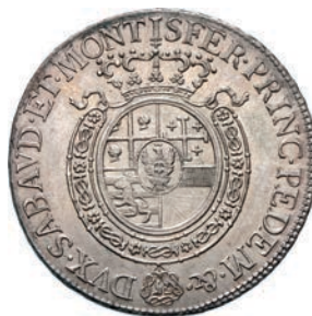
390. VITTORIO EMANUELE I (1802-1821) Mezzo Scudo 1814 Torino. MIR 1021 Pag. 16 Ag g 17,54 Molto rara • Bell'esemplare; piccole ossidazioni al dritto