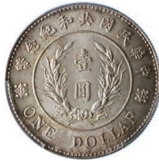
767. Dollaro s.d. (1914) Y. 322 L.&M. 858 Ag • PCGS MS65