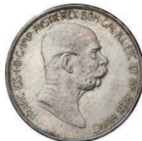
736. 5 Corone 1900. Kr. 2807 Dav. 34 Ag g 24,01