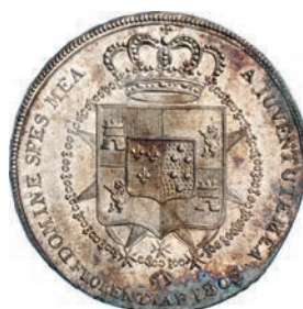
503. Mezza Dena 1803. Pag. 33 Ag g 19,63 Rara • Eccezionale