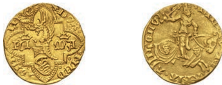
300. MILANO FILIPPO MARIA VISCONTI (1412-1447) Fiorino s.d. D/ Il Duca a cavallo con spada sguainata R/ Scudo inclinato sormontato da elmo con cimiero del drago; il tutto entro cornice. Crippa 1 MIR 150 Au g 3,49 Rara BB 600