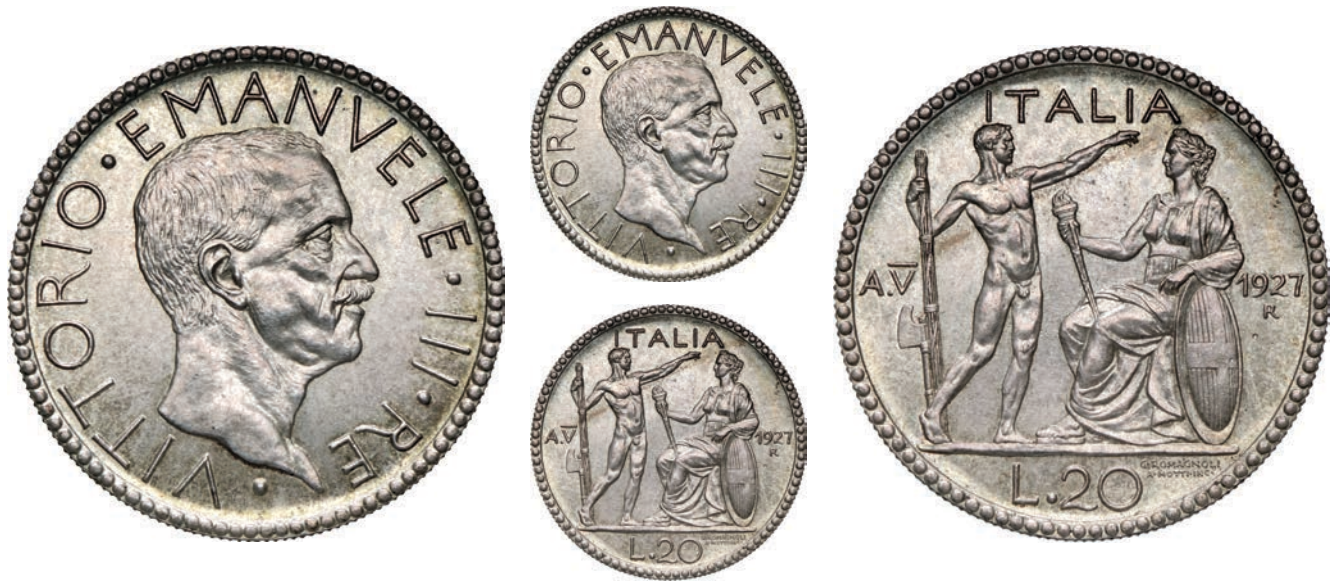
243. 20 Lire 1927 V Roma "littore". Pag. 671 MIR 1128a Ag g 15,01 Rarissima • Tiratura di soli 100 pezzi. Esemplare con piacevole patina FDC 8.000