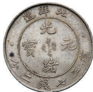
774. CINA - Chihli Dollaro A. 34 (1908) Kuang-hsü Y. 73.2 Dav. AAO 187 Ag g 26,81 SPL 400