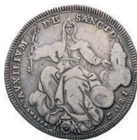
512. Mezzo Scudo 1802 II, Roma. Pag. 68 Ag g 12,92 Molto rara MB 100