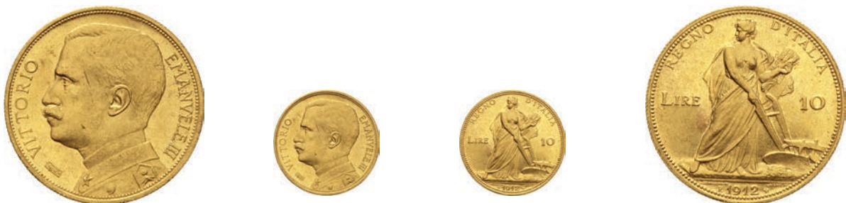
247. 10 Lire 1912 Roma "aratrice". Pag. 688 MIR 1131b Au g 3,22 Molto rara q.FDC 6.000