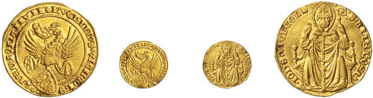
298. Fiorino. Crippa 1 MIR 93 Au g 3,50 Estremamente rara • Modesta ondulazione del tondello; moneta di grande rarità q.SPL 24.000