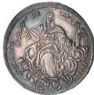
511. PIO VII (1800-1823) Scudo 1815 XVI, Roma. Pag. 106 Ag g 26,42 Rara SPL 300