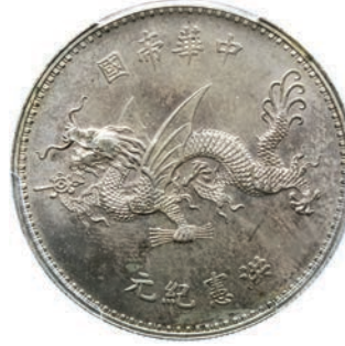
768. Dollaro s.d. (1916) Y. 332 L.&M. 942 Ag • PCGS UNC detail (restauration recommandée). Eccezionale, a nostro avviso MS64/65 dopo pulitura