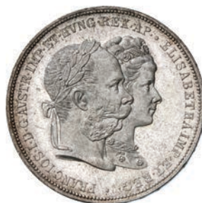
734. 2 Gulden 1886. Kr. 2233 Dav. 27 Ag g 24,63