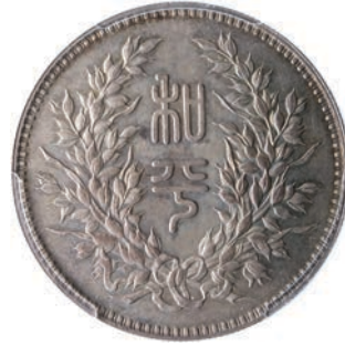
771. Dollaro s.d. (1924) Kr. 683 L.&M. 865 Ag • PCGS MS62 SPL/q.FDC 4.500