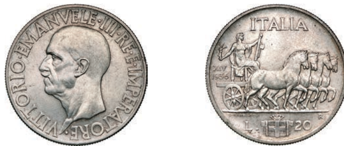
246. 20 Lire 1936 XIV Roma "impero o quadriga". Pag. 681 MIR 1130a Ag g 20,05 Rara • Esemplare con rigatura fine SPL 1.000