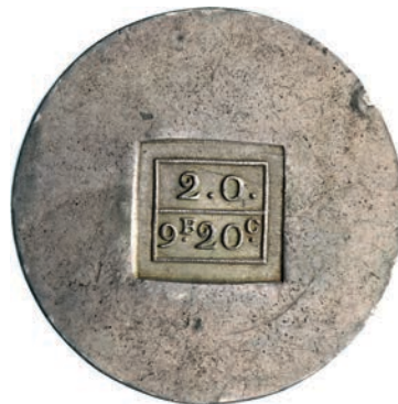
450. 9,20 Franchi 1813. Pag. 312 Ag g 59,47 Molto rara