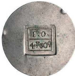
451. 4,60 Franchi 1813. Pag. 313 Ag g 29,65 Molto rara